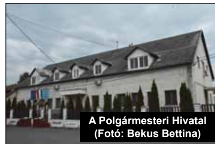
A Polgármesteri Hivatal

Az önkormányzat szeptember 23-án rendezi meg a városnapot, ahol a „nagyfellépő” a Lord zenekar lesz.