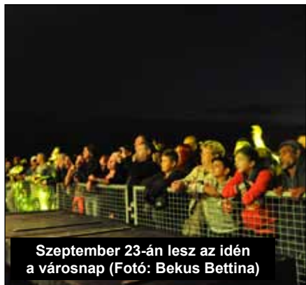
Szeptember 23-án lesz az idén a városnap

zottsági ülésen tanácskozási joggal résztvevő személyekre, – az eljárás során döntést hozó személyre vagy testületre (Onga Város Önkormányzat Képviselő-testülete).