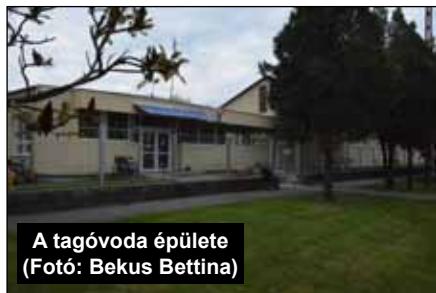
A tagóvoda épülete

A 2016-os év is a szigorú gazdálkodás jegyében telt el. A pénzügyi források csökkenése miatt az intézményben a legfontosabb személyi és dologi kiadásokon kívül fejleszté-