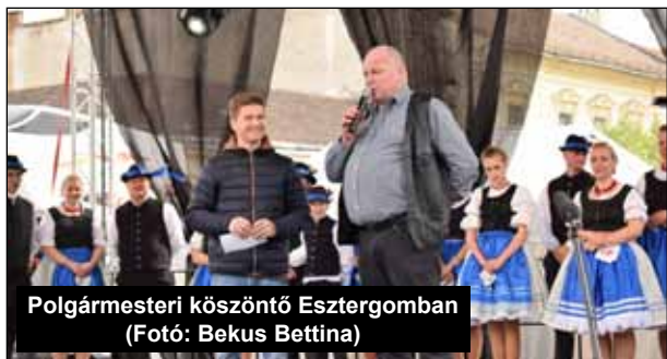
Polgármesteri köszöntő Esztergomban