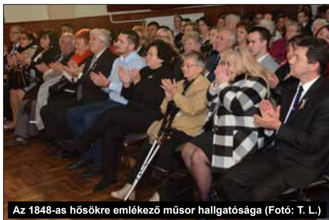
Az 1848-as hősekre emlékező műsor hallgatósága