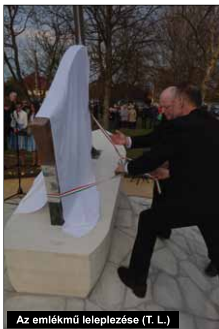
Az emlékmű leleplezése (T. L.)