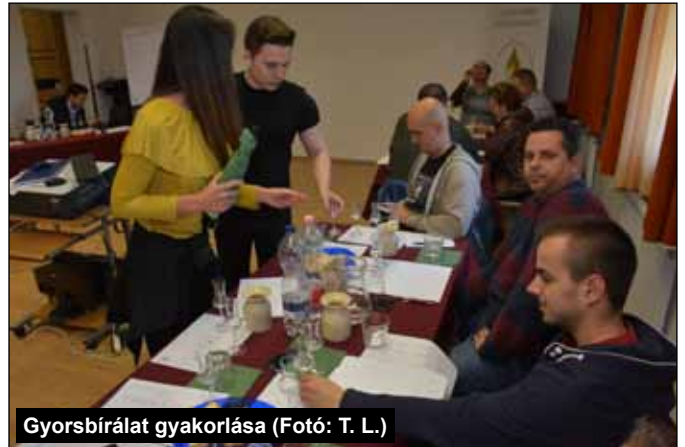
Gyorsbírálat gyakorlása