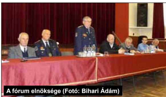
A fórum elnöksége

2017. április 19-én került sor az Ongai Polgárőr Egyesület szervezésében egy bűnmegelőzési fórumra.