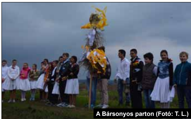
A Bársonyos parton