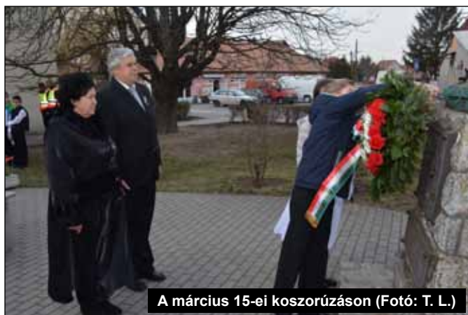
A március 15-ei koszorúzáson