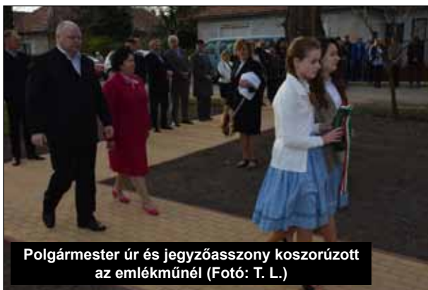
Polgármester úr és jegyzőasszony koszorúzott az emlékműnél

Az 1956-os emlékévként keretében az 1956-os Emlékbizottság megbízásából a Közép- és Kelet-európai Történelem és Társadalom Kutatásáért Közalapítvány által kiírt „Büszkeségpont” megnevezésű pályázaton 5.000.000,- Ft támogatást nyert Onga Város Önkormányzata, „A szabadság vihara – 1956-os emlékmű létrehozása Onga városban” megnevezésű projekt megvalósítására. Magyarország kormánya határozat-