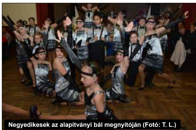
Negyedikesek az alapítványi bál megnyitóján