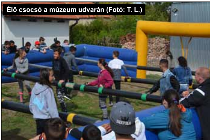
Élő csocsó a múzeum udvarán