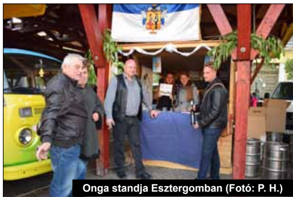
Onga standja Esztergomban