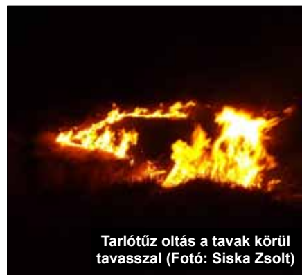
Tarlótűz oltás a tavak körül tavasszal

Erdőtűz-veszélyes időszakban országos szinten a vidékfejlesztési miniszter, területi szinten az erdészeti hatóság tűzgyújtási tilalmat rendelhet el, mely esetén az érintett területen akkor is tilos a tűzgyújtás – beleértve a kijelölt