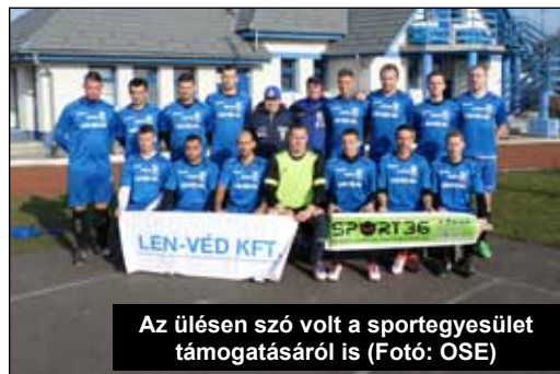
Az ülésen szó volt a sportegyesület támogatásáról is

Alapszolgáltatásokat nyújtó Ongai Szociális Szolgáltató Központban a preventív és korrektív (kijavító) rendszerszemléletű szociális munka értékeinek mentén komplex segítséget nyújt az intézmény szolgáltatásait igénybe vevők képességeinek és készségeinek megőrzéséhez, erősítéséhez, fejlesztéséhez. Elsődleges számukra az emberi méltóság tisztelete, az együttműködésen alapuló személyes szolgáltatás, az egyén szükségleteire irányuló egymást segítő, építő tevékenység. A társulás összetételének, tagjainak tekintetében a 2016. év folyamán változás nem történt.