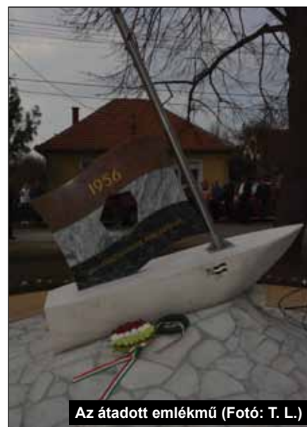
Az átadott emlékmű