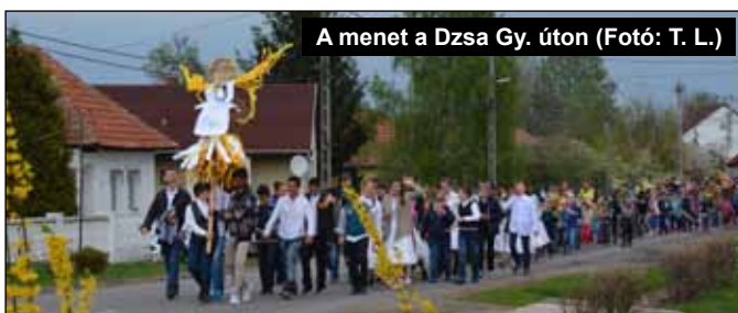
A menet a Dzsa Gy. úton