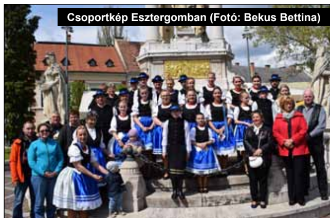
Csoportkép Esztergomban

örző tevékenységünk. A közönséget egy abaúji népdallal köszöntöttük, majd ezt követően gagybátori, bodrogközi, szatmári, magyarbódi, galga-menti, szilágysági táncokat láthatott tőlünk a közönség. Zárásként a Zsálya együttes „Gyere ki szívem” című számára táncoltunk, melyben Bognár Lili Janka ongai népdalénekes hallható. A műsorunkat követően sok dicséretet kaptunk, mind a viseletünket, mind pedig