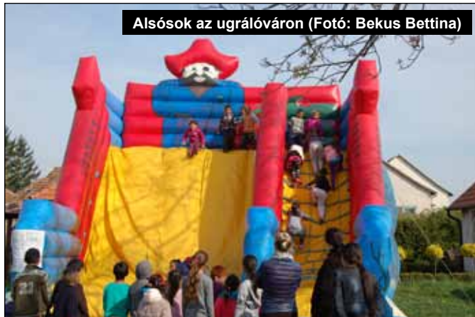
Alsósok az ugrálóváron

van. Még a folyó tanév befejezése előtt szeretnénk megtartani az első szülői értekezletet.