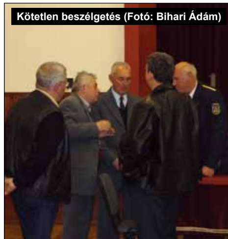
Kötetlen beszélgetés