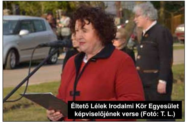
Éltető Lélek Irodalmi Kör Egyesület képviselőjének verse

köztéri alkotás megvalósítását határozta el, azzal a céllal, hogy hozzájáruljon a társadalmi emlékezet ébren tartásához, valamint a közös értékeken, múlton és kultúrán alapuló magyar közösségi identitás erősítéséhez. Egyben emlékezzünk 1956 ongai hőseire,