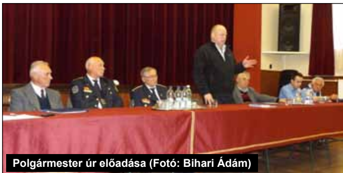
Polgármester úr előadása