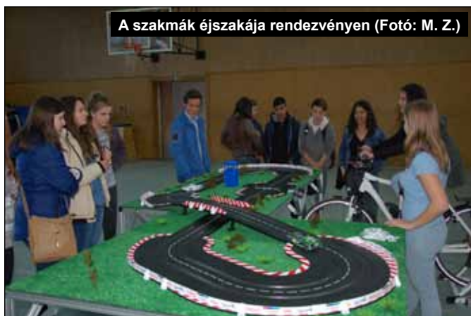
A szakmák éjszakája rendezvényen