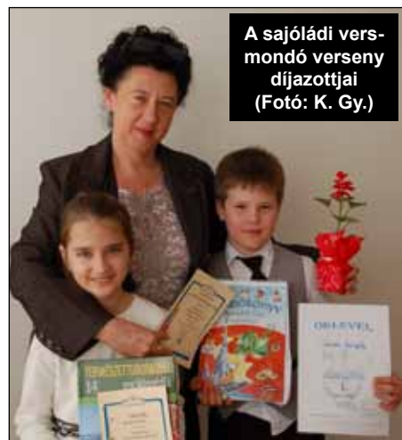
A sajlódi versmondó verseny díjazottjai