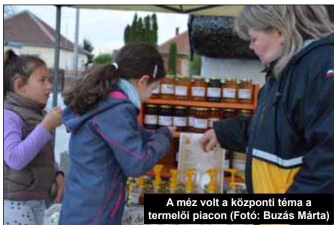
A méz volt a központi téma a termelői piacon