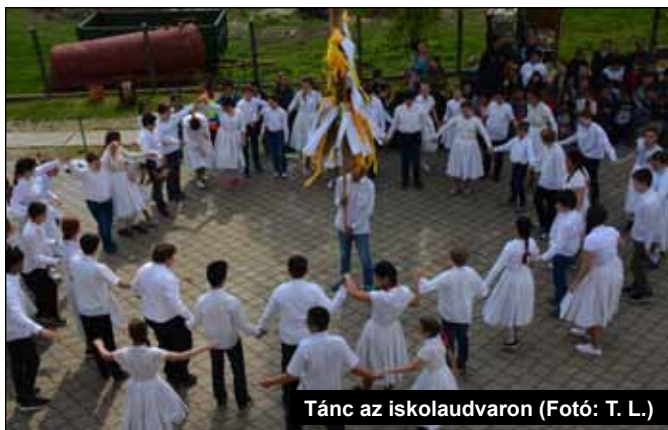
Tánc az iskolaudvaron