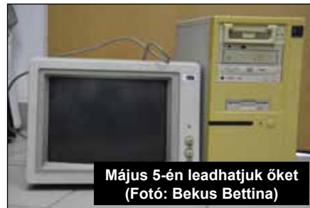
Május 5-én leadhatjuk őket

Ezek a tárgyak használatuk során veszélytelenek, de a hulladékká vált tárgyakat fontos, hogy elkülönített gyűjtőbe gyűjtsük, ha a kommunális hulladék