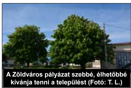
A Zöldváros pályázat szebbé, élhetőbbé kívánja tenni a települést

2014. július 1-jétől megszűnt a papír alapú anyakönyvezés, a korábbi négyféle (születési, halotti, házassági, bejegyzett élettársi kapcsolati) anyakönyvet egyetlen, személyhez