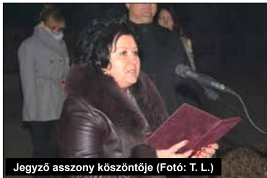
Jegyző asszony köszöntője

S ha kialszik mind a négy, szenteste gyúl helyettük ünnepi fény... És nem kell, csupán egyetlen ajándék, mit szívem karácsonyon úgy remél: láthassam szemedben csillogni még, sokáig e szépséges, adventi gyertyafényt.