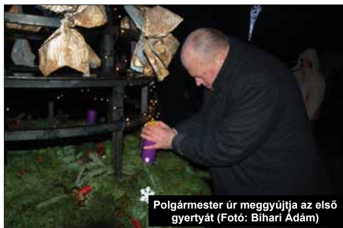
Polgármester úr meggyújtja az első gyertyát