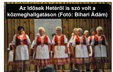
Az Idősek Hetéről is szó volt a közmeghallgatáson

A 2015. szeptember 1-én életbe lépő új Köznevelési Törvény értelmében minden 3. életévét betöltött gyermek számára kötelezővé vált az óvodai nevelés. Az óvodai feladatellátás biztosítása érdekében a Bársonyos Napközi Otthonos Óvoda mindkét feladat ellátási helyén a 2015/2016. nevelési évben 51 férőhelyes kapacitásbővítés valósult meg. A Központi Óvoda egy, míg a Tagóvoda két új óvodai csoportszobával és kiszolgáló helyiségekkel bővült. A tornaszoba új sportpadlót kapott, a kapcsolódó eszközök, játékok, felszerelések beszerzése is megtörtént. A beruházás összköltsége 60,3 millió forint, ebből a pályázati támogatás mértéke 95%. A munkálatok nem zavarták a nevelőmunkát, az óvodai dolgozók hozzáállása példaértékű volt, hiszen önként vállalták a hétvégi ügyeletet is.