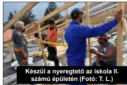
Készül a nyeregtető az iskola II. számú épületén

Sportegyesületünk labdarúgó és asztalitenisz szakosztályát továbbra is működtetjük.