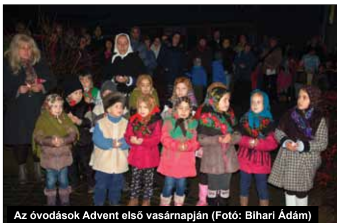
Az óvodások Advent első vasárnapján