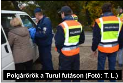
Polgárőrök a Turul futáson

Polgárőr Egyesület. Az Egyesület részére a Városi Rendészeti Központban a Berzsényi u. 9. sz. alatt új központi iroda helyiség került kialakításra.