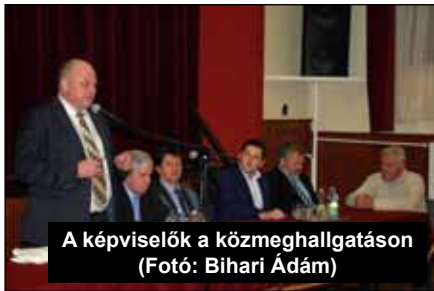
A képviselők a közmeghallgatáson

kozáshoz. Továbbá folyamatban van az aszaló üzem kialakítása, amely berendezéseire: (gyümölcs tisztító szalag, gyümölcs előkészítő, gyümölcs-aprító, hűthető fűthető tartály) közel 8 millió forintot költöttünk. A közfoglalkoztatásra pályázaton elnyert bértámogatás 188,5 millió forint, továbbá eszköz- és anyagbeszerzésre elnyert összeg 36 millió forint volt.