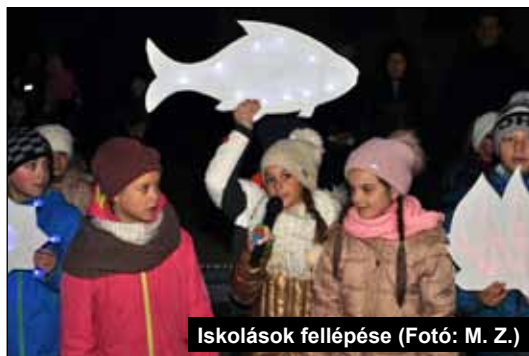
Iskolások fellépése

Szólhatok az emberek vagy az angyalok nyelvén ha szeretet nincs bennem, csak zengő érc vagyok vagy pengő cimbalom. Lehet prófétáló tehetségem, ismerhetem az összes titkokat és mind a tudományokat,