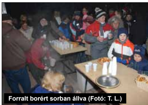
Forralt borért sorban állva

Városunk ünneplőbe öltözött, ün- neplőbe öltöztek utcáink, karácsonyi fényekkel pompáznak.