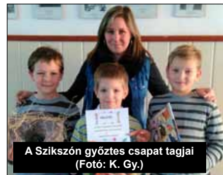
A Szikszón győztes csapat tagjai