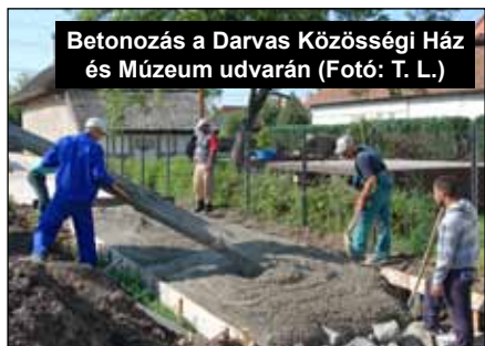
Betonozás a Darvas Közösségi Ház és Múzeum udvarán

Minden évben részt veszünk az Országos Könyvtári Napok rendezvénysorozatán különböző programokkal, erre minden évben október első héten kerül sor.