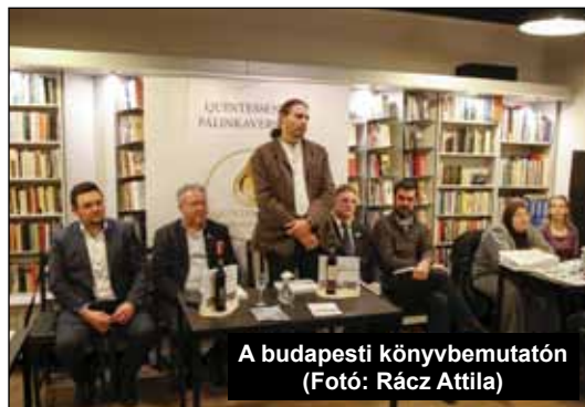
A budapesti könyvbemutatón

A könyv 5800 Ft-os áron megvásárolható, kitérő ajándék karácsonyra