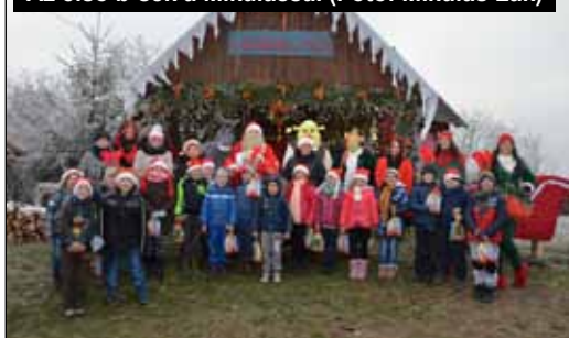
Az első b-ek a Mikulással

Iskolánk alsó tagozatos osztályaiba is megérkezett a Mikulás. Tanulóink kis műsorokkal, versekkel és énekekkel köszöntötték a nagyon várt vendéget. Néhány osztály útra kelt, hogy kuckójában találkozhasson Télapóval. A szikszói Mikulás Lak program résztvevői az ajándécsomagok mellé kis műsort és kézműves foglalkozást is kaptak. A pazar helyszín, és a lelkes fogadtatás maradandó élményt nyújtott minden tanuló számára.