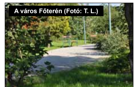
A város Főterén