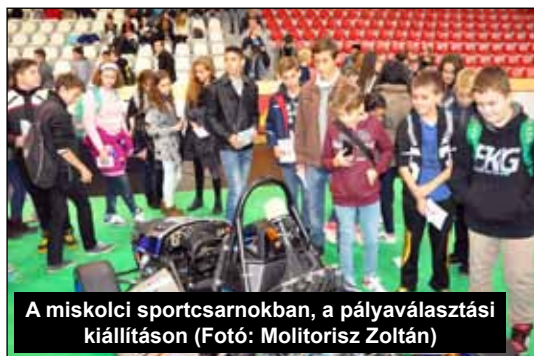
A miskolci sportcsarnokban, a pályaválasztási kiállításon

A „Mi a pálya? műszaki pályaválasztó fesztivált kétórás blokkokban szervezte a Miskolci Szakképzési Centrum a városi sportcsarnokban, Miskolcon. A Görgey Artúr Általános Iskola és Alapfokú Művészeti Iskola 7. évfolyamos tanulói is ott lehettek a fesztiválzók között. A pályaválasztó bemutató