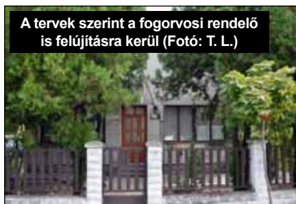
A tervek szerint a fogorvosi rendelő is felújításra kerül

„Településképet meghatározó épületek külső rekonstrukciója, többfunkciós közösségi tér létrehozása, fejlesztése, energetikai korszerűsítése” pályázati felhívás célja a vidéki térségekben élők életminőségének a javítása, a vidéki települések vonzóbbá tétele olyan, a fenntarthatóság növelését és a társadalmi felzárkózást és az egész életen át tartó tanulást elősegítő fejlesztések ál-