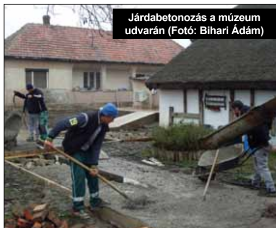
Járdabetonozás a múzeum udvarán

Ugyancsak elkészültek az udvaron egy új épület tervei, ahol oktatási céllal egy gyümölcsfeldolgozó központ kerül kialakításra.