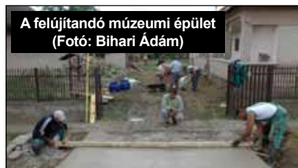
A felújítandó múzeumi épület

Az eddigi felajánlásokat, támogatásokat az egyesület vezetősége ezúton is köszöni, és továbbra is számít rájuk!