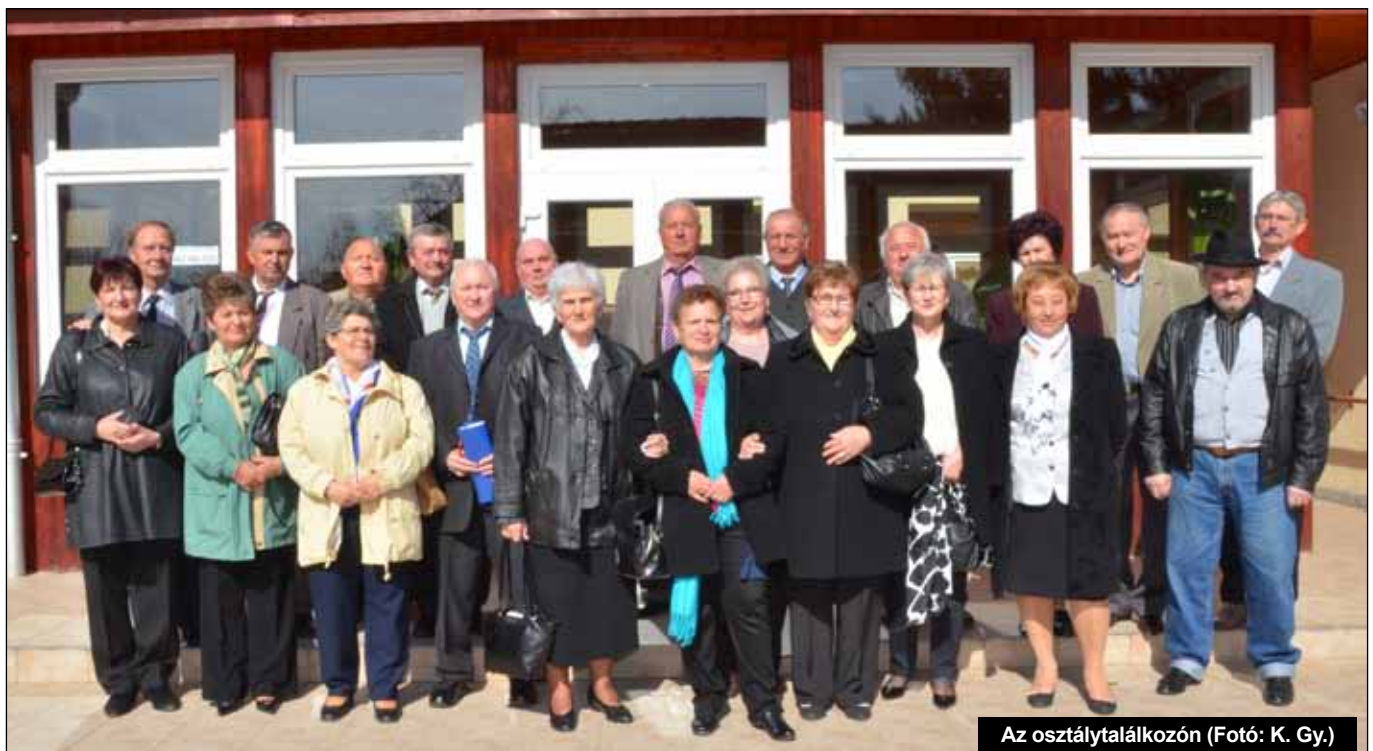
Az osztálytalálkozóon