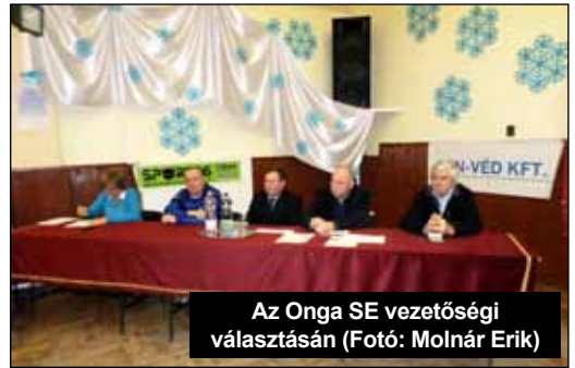
Az Onga SE vezetőségi választásán

Egyesületünk ismételten megerősítette sikeres együttműködését az ongai polgárőrséggel. Az új megállapodás értelmében polgárőrök őrködnek a pályán, megakadályozva