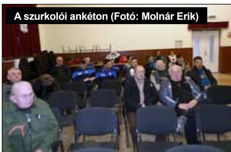
A szurkolói ankéton