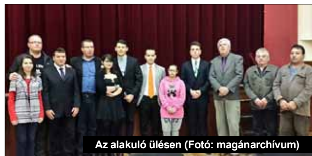
Az alakuló ülésen