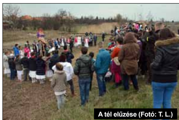
A tél elűzése