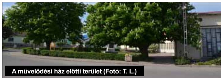
A művelődési ház előtti terület