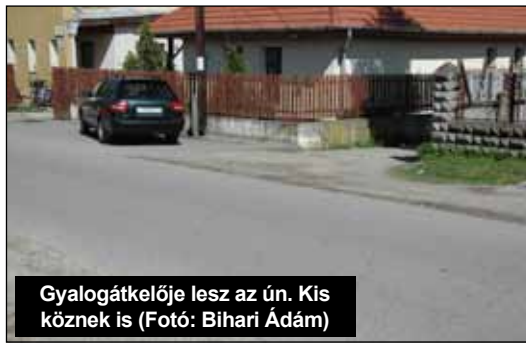
Gyalogátkelője lesz az ún. Kis köznek is

Az általános iskolából a tanulók a Gyöngyvirág utcán lévő Kóczán-kastély épületébe járnak ebédelni. Az eljutás az iskolától, az ún. Kis közön át a viszonylag nagy forgalmú Rákóczi utcán át vezet az ebédlőig. Ezáltal válik elsődlegesen fontossá a biztonság átkelés érdekében a Rákóczi utca ezen szakaszán gyalogátkelőhely létesítése. A gyalogátkelőhely felfestés-