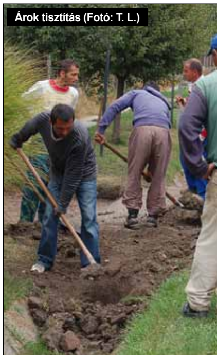
Árok tisztítás