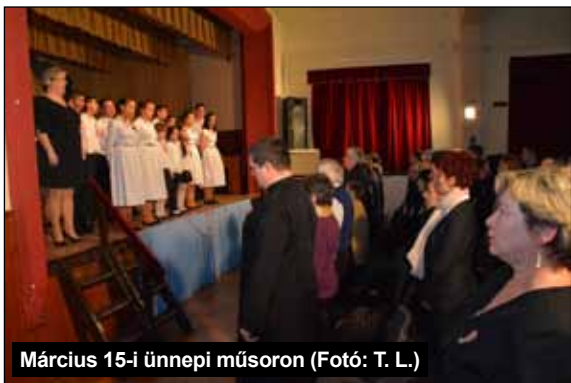
Március 15-i ünnepi műsoron

Március hava iskolánk életében több szempontból is kiemelt jelentőséggel bírt. Tanulóink számos program keretében köszöntötték a tavaszt. A szokatlanul korai tavaszi szünetre is ebben a hónapban került sor. Ebben az időszakban a tanulmányi versenyek is egyre sűrűbbé válnak.