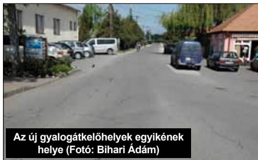
Az új gyalogátkelőhelyek egyikének helye (Fotó: Bihari Ádám)

Onga Város Önkormányzat Képviselő-testülete megtárgyalta a „Javaslat