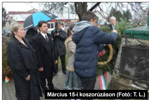
Március 15-i koszorúzáson

Sikeresen lezajlott a beiratkozás az első évfolyamra. A várt létszámú tanulócsoportok szeptemberi indításával kapcsolatos szülői értekezletre májusban kerül sor. A tanév további előkészítése folyamatosan zajlik. Többek között a tankönyvek megrendelése,