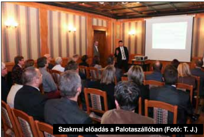
Szakmai előadás a Palotaszállóban