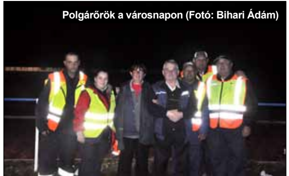
Polgárőrök a városnapon

igazítási feladatokban is, az elvárásoknak megfelelően.