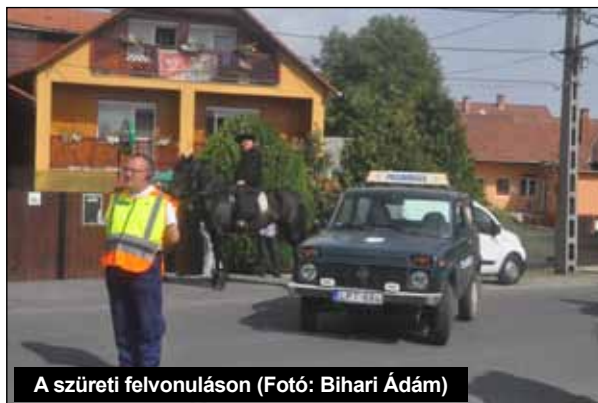
A szüreti felvonuláson