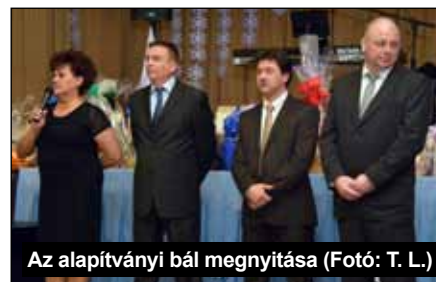
Az alapítványi bál megnyitása