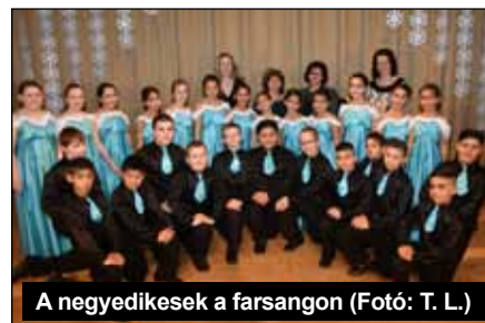
A negyedikesek a farsangon

Intézményünk névadójához méltó működésével, felelős és áldozatos munkájával igyekszik feladatait ellátni. Bízunk abban, hogy a névadónkhoz sokszor oly kegyetlen sors a munkánkat támogatni fogja.