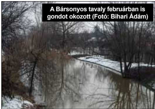
A Bársonyos tavaly februárban is gondot okozott

A katasztrófavédelem illetékei azt válaszolták megkeresésünkre,