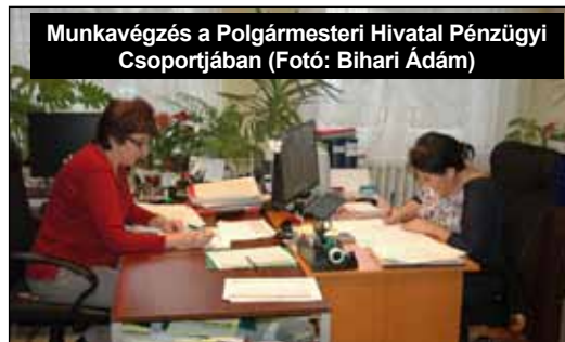
Munkavégzés a Polgármesteri Hivatal Pénzügyi Csoportjában

A múlt havi számunkban már elkezdtük a Polgármesteri hivatal tavalyi évi munkájának bemutatását, amit most folytatunk. A február 9-ei önkormányzati képviselő-testületi ülésen fogadták el a képviselők a Polgármesteri Hivatal és a karbantartó csoport munkájáról szóló beszámolót. Talán nem érdektelen a város lakossága számára sem, ha megismeri ennek a tájékoztatónak a sarokpontjait. A több mint 50 oldalas beszámolót nincs módunk teljes egészében közzétenni, de néhány fontosabb elemével szeretnénk megismertetni a tisztelt olvasókat.