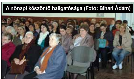
A nőnap köszöntő hallgatósága