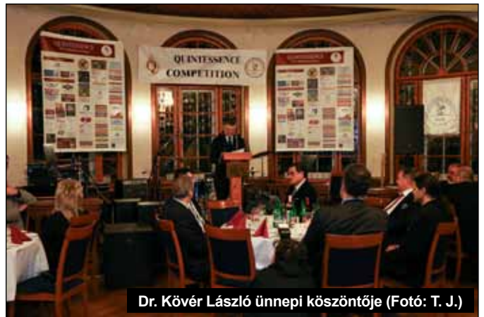
Dr. Kövér László ünnepi köszöntője