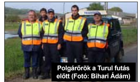
Polgárőrök a Turul futás előtt

Ne feledje, az elkövetők nemcsak azokat a lakásokat törik fel, ahol valószínűsíthető a nagy zsákmány, hanem azokat is, ahol zavartalanul követhetik el a bűncselekményeket!