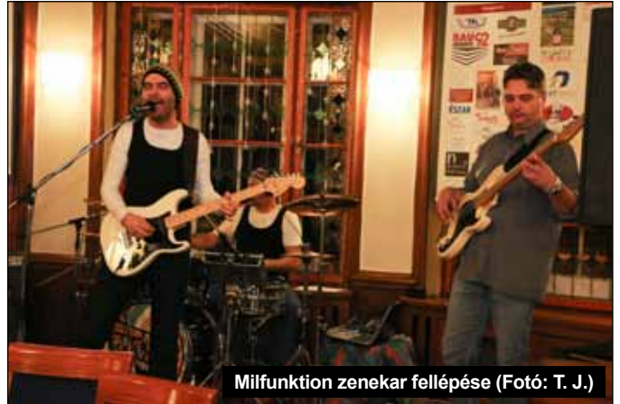
Milifunktion zenekar fellépése