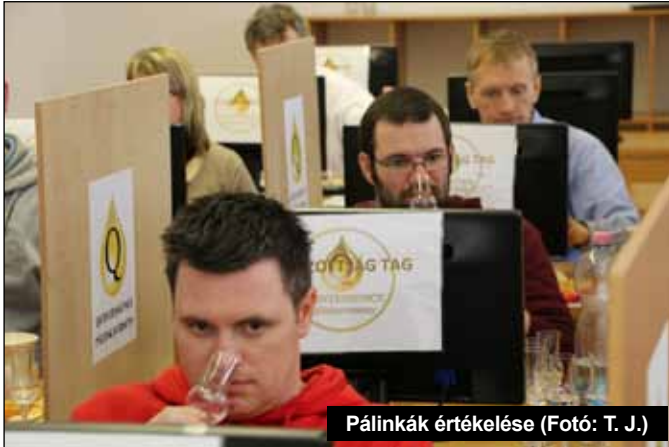
Pálinkák értékelése