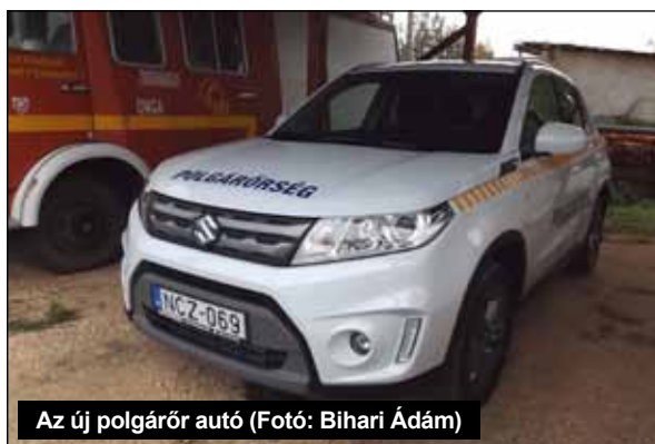
Az új polgárőr autó

Külterületi lakóhely tekintetében Ongaújfalu és környéke,