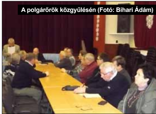
A polgárőrök közgyűlésén

A teljesség igénye nélkül, de összességében elmondhatjuk az Ongai Polgárőr Egyesület a 2015. évben működését töretlenül folytatta, a vállalt feladatnak igyekezett megfelelni. Nőtt a tagok aktivitása, sikerült nem várt helyzetekben is eredményeket elérni. Egyre erősödő csapatszellem, fegyelmettség tevékenység jellemezte a tagok önkéntes munkáját. Létszámunk az elvárásnak megfelelően alakul, a tervezett fiatalítás sikeresen elkezdődött. Ezen feladatok nem valósulhattak volna meg az egyesület tagjainak önfeláldozó munkája nélkül. Áldozatos munkájuk nagyban hozzájárult az egyesület terveinek, vállalásainak megvalósulásához. Céljaink és feladataink megvalósítását önkéntesek és támogatók is segí-