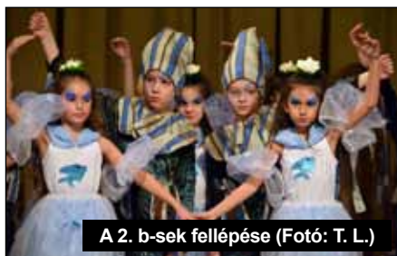
A 2. b-sek fellépése

A tanév második félévében szeretnénk javítani a tanulói teljesítményeket. A kompetencia-mérésekre való alapos felkészüléshez igyekszünk minden lehetőséget megragadni. A második felév a tanulmányi- és sportversenyek időszaka is. Versenyeredményeink szinten tartása komoly felkészítő munkát igényel. Zsúfolt munkatervünkben több nagyon jelentős program szerepel, amelyeket