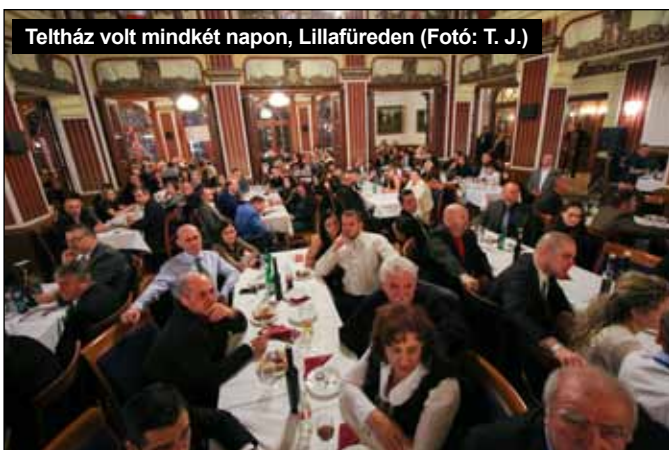
Teltház volt mindkét napon, Lillafüreden