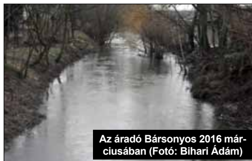
Az áradó Bársonyos 2016 márciusában

Szintén küldtünk egy levelet a Megyei Kormányhivatal Környezetvédelmi és Természetvédelmi Főosztályára, hogy adják meg számunkra azt, hogy milyen munkálatokat lehet elvégezni a Bársonyoson vízjogi létesítési engedély beszerzése nélkül annak érdekében, hogy a mederben a víz áramlása elfogadható legyen.