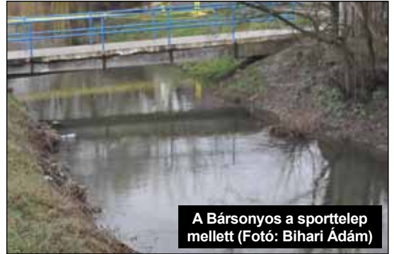
A Bársonyos a sporttelep mellett

Ezek után bejelentéssel éltünk és kértük a Vízügyi Igazgatóságot, mint az öntöző főcsatorna kezelőjét, hogy tegye rendbe a Bársonyost, mert még is csak az állam által rájuk van bízva ennek rendben tartása. Továbbá ugyanezt a bejelentést megtettük a katasztrófavédelem felé is, mert a Bársonyos vízszintje már károsítja nem kevés érintett lakos anyagi javait.