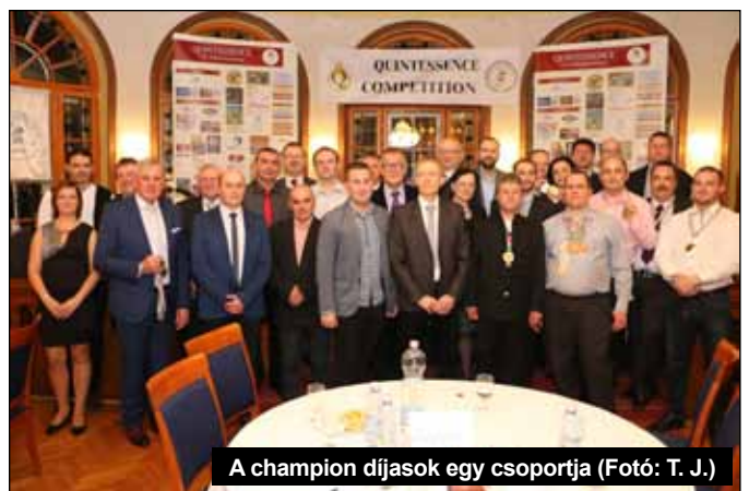
A champion díjasok egy csoportja