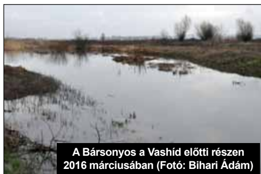
A Bársonyos a Vashíd előtti részen 2016 márciusában

Haladjunk sorjában. Az ÉVIZIG első levelében azt válaszolta, hogy takarítsuk ki a medret, de tartsunk be minden szabályt és biztosítsuk a meder két oldalán a 6 méteres sávot, hogy mint kezelő tudjon ott mozogni.