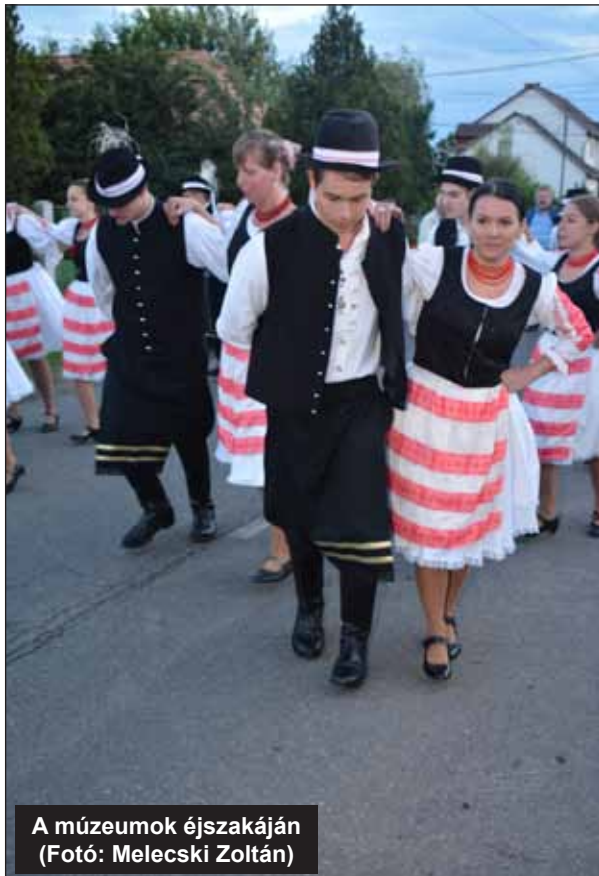
A múzeumok éjszakáján