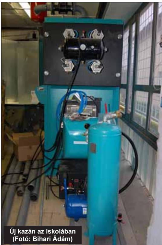
Új kazán az iskolában