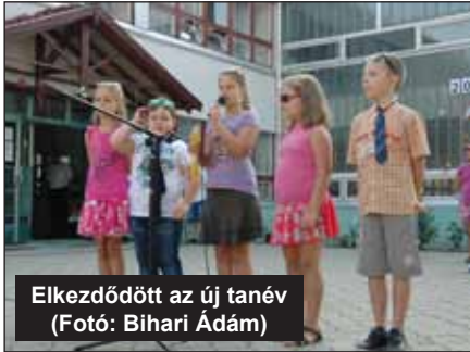
Elkezdődött az új tanév

Számos meglepetéssel indult az új tanév. Többek között az általános iskolánkban megvalósuló korszerűsítési folyamatok aktuális helyzetéről számolunk be az alábbiakban.