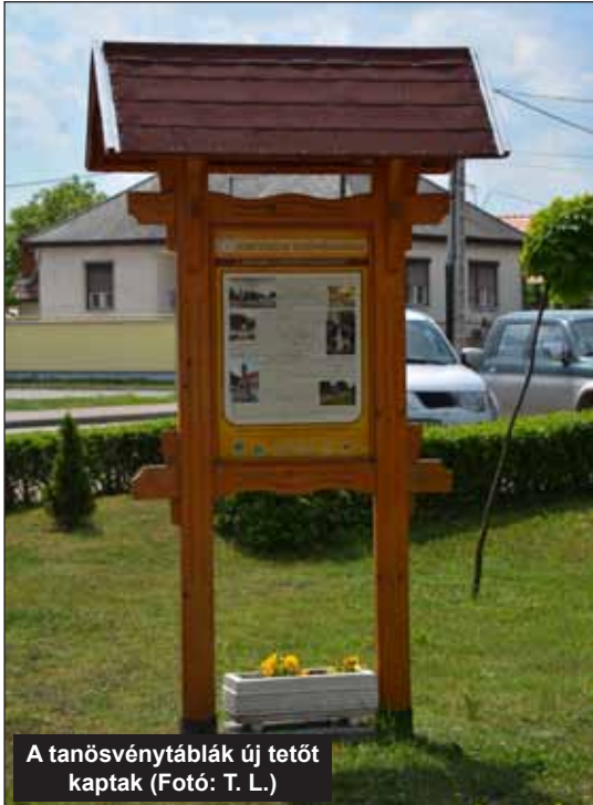
A tanösvénytáblák új tetőt kaptak