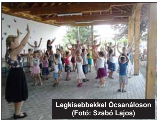
Legkisebbségekkel Ócsanáloson