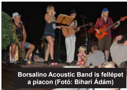
Borsalino Acoustic Band is fellépet a piacon