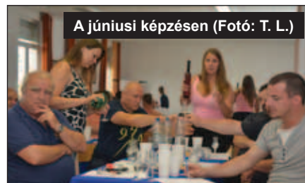
A júniusi képzésen

Az összesen 10 napból álló képzésre alkalmanként is részt lehet venni, de a képzéssorozaton való részvételről kiállított tanúsítványt sikeres vizsga után csak az kaphat, aki minimum 7 alkalommal részt vett a képzésen.