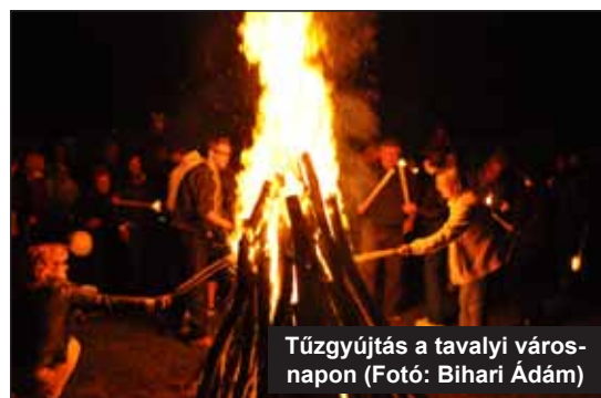
Tűzgyújtás a tavalyi városnapon