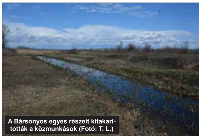
A Bársonyos egyes részeit kitarították a közmunkások

A személyi juttatások és a munkaadókat terhelő járulékok 218 fő részére lettek kifizetve, ebből a közfoglalkoztatott dolgozók átlag létszáma június 30-ig számolva 170 fő volt.