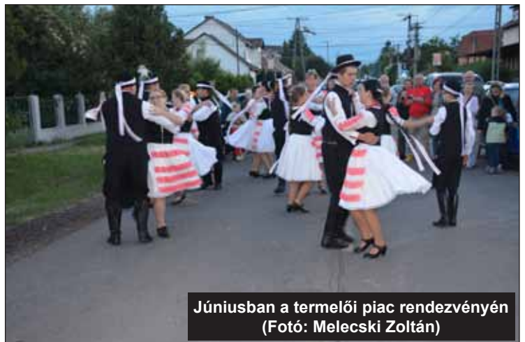
Júniusban a termelői piac rendezvényén