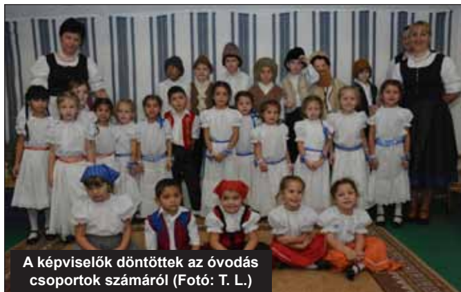
A képviselők döntöttek az óvodás csoportok számáról

Onga Város Önkormányzat Képviselő-testülete a város nevelési-oktatási intézményeiben fizetendő étkezési térítési díjakat az alábbiak szerint állapította meg (a feltüntetett árak az áfát nem tartalmazzák). Az oktatási, nevelési intézményekben fizetendő térítési díjak az általános iskolában, a napköziben: 379 Ft, ebéd: 231 Ft, az óvodákban: 305 Ft.