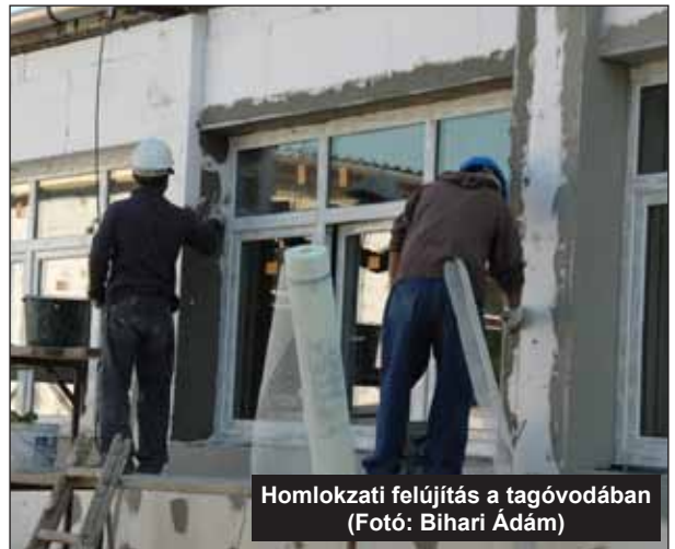
Homlokzati felújítás a tagóvodában

Onga Város Önkormányzat Képviselő-testülete a 4/2014. (I. 31.) BM rendelet alapján az Arany János utcai tagóvoda épületének felújítását célzó (igénylésazonosító: 192579) projekt „Onga, Bársonyos Napközi Otthonos Óvoda tagóvoda-