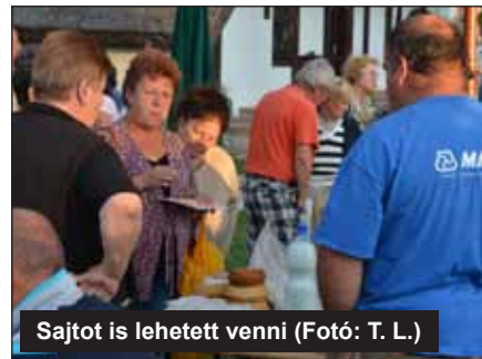
Sajtot is lehetett venni