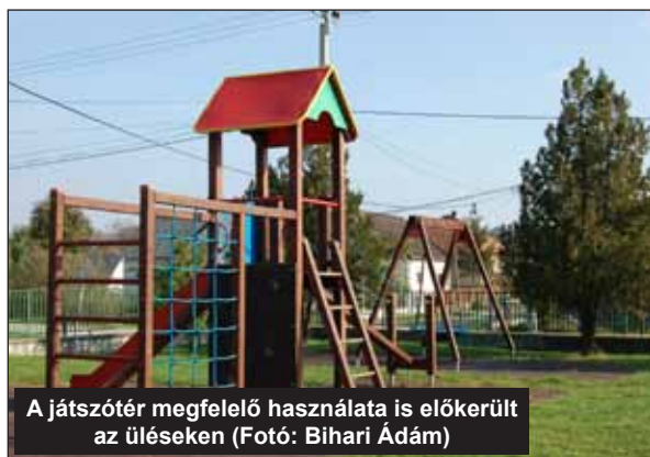
A játszótér megfelelő használata is előkerült az üléseken

Európai Unió forrásokból megvalósítandó pályázatok: ÉMOP-4.2.1/A-11-2012-0028 Szociális alapszolgáltatások fejlesztése Ongán – Épületek felújítás: 662 ezer Ft. KEOP-4.10.1/A/12-2013-0495 Biomassza kazán telepítése – Iskola: 57.762 ezer Ft.