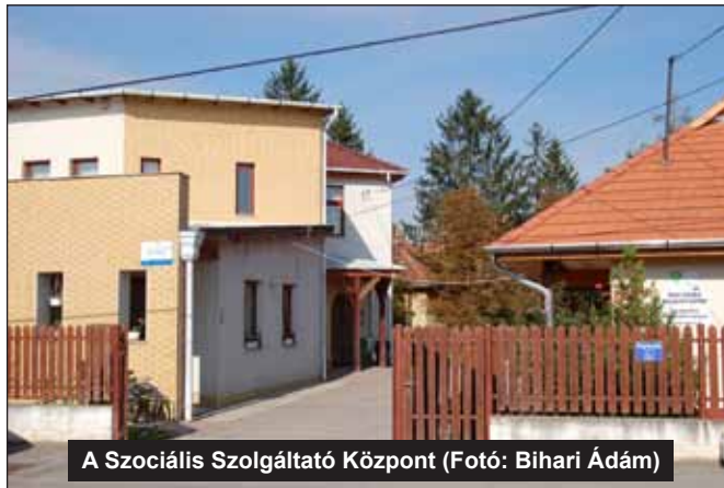
A Szociális Szolgáltató Központ

Az ÉMOP-4.3.1/A-12-2012-0025 pályázaton nyert „Évszakoktól független mindennapos testnevelés órák megtartásához szükséges komplex infrastrukturális feltételrendszer kialakítása az ongai Görgey Artúr Iskolában” – iskola tornacsarnok bővítés a képviselő-testület döntése szerint nem valósult meg, így a kapott támogatás összegét, 3. 725 e Ft-ot visszafizettük.