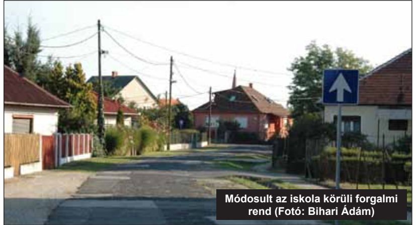
Módosult az iskola körüli forgalmi rend

jű határozatok végrehajtásáról szóló beszámolót elfogadta. 2015. január 1. és március 31. között az önkormányzati segéllyel kapcsolatban 7 db I. fokú határozat született, ebből 5 db határozattal megállapításra került az önkormányzati segély, 2 kérelem ke-