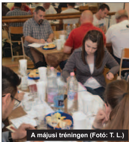
A májusi tréningen