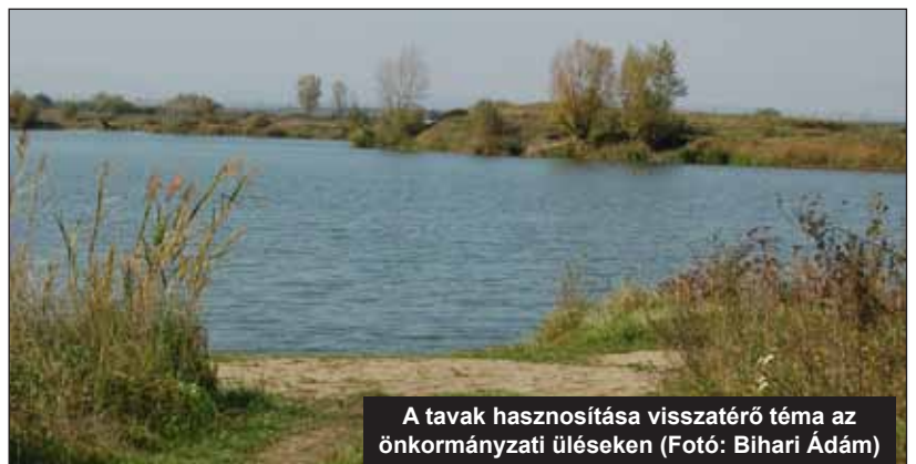
A tavak hasznosítása visszatérő téma az önkormányzati üléseken