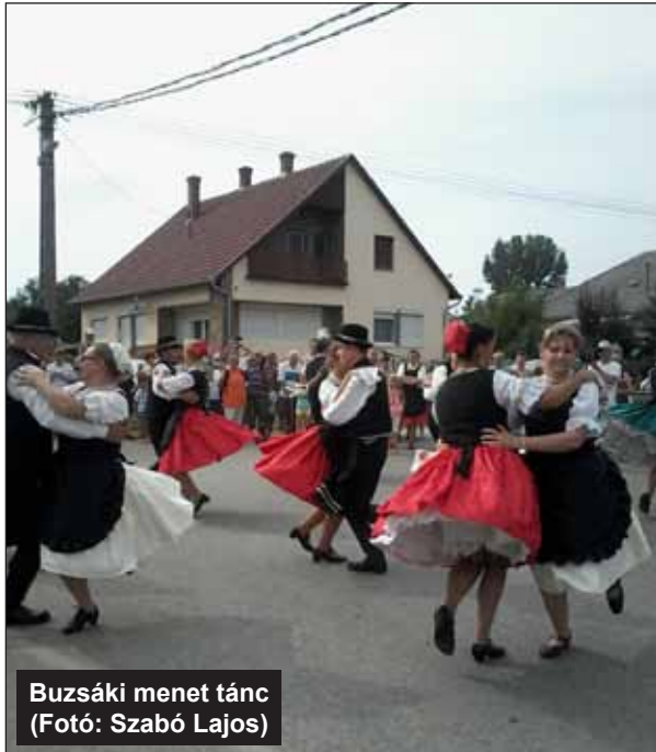
Buzsáki menet tánc