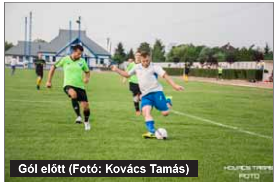
Gól előtt