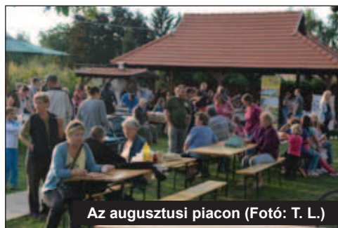
Az augusztusi piacon