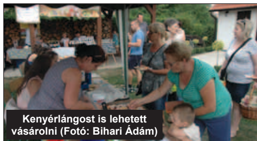
Kenyérlángost is lehetett vásárolni