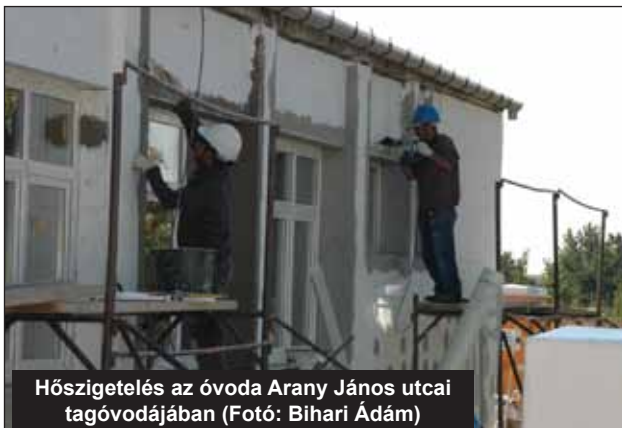
Hőszigetelés az óvoda Arany János utcai tagóvodájában

Az ülésen szó volt többek között kavicsbányászathoz kötődő földcseréről, arról, hogy az önkormányzat az állami tulajdonba került általános iskola fenntartásához havi 1 406 000 Ft-tal járul hozzá, mely összeget minden hónap 5-éig utal át az államkincstárnak. Szó volt a Bársonyos közcélú munkások általi kitakarításáról, a játszótér megfelelő használatáról, a kerti hulladék égetéséről, a szelektív hulladékgyűjtők körüli áldatlan állapotokról, az ún. Coopos-bolt mögötti gaz eltüntetéséről, ócsánalosi fűvágásokról, az Akác utca útburkolatának romlásáról, arról, hogy a Vermekben újra lehessen megfelelő körülmények között focizni.