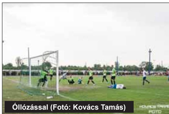
Óllózással