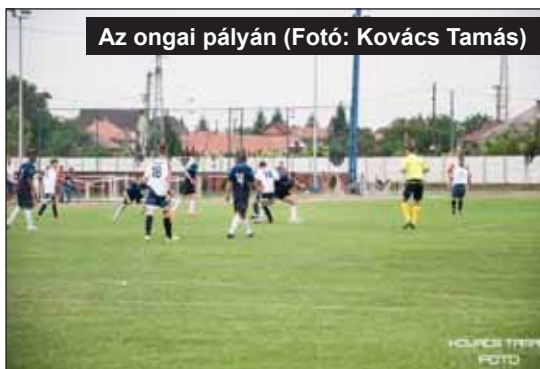
Az ongai pályán

Az úgynevezett Bozsikos korosztályoknak is véget értek a megpróbáltatások. Összességében elmondható, hogy nagyon jól szerepeltek. A legjobb eredményeket az U11-es csapat hozta. Az U11-U13-as korosztály Böcsön játszott kéthetente szombatonként, az U9-U7-esek Felsőzsolcán. A gyermekek edzéseit az egyesület és az iskola közösen oldotta meg egy nagyon jól működő partnerkapcsolat keretein belül. Hasonló a rendszer az óvodában is. Nagyon biztató a jövőre nézve, hogy az óvodás korosztályban 34 gyerek jelentkezett az edzésekre, belőlük