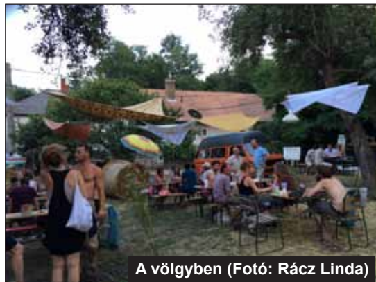
A völgyben