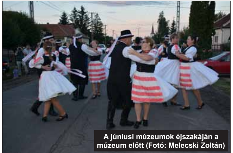
A júniusi múzeumok éjszakáján a múzeum előtt