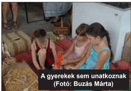
A gyerekek sem unatkoznak