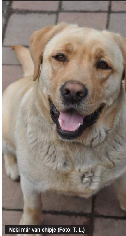
Neki már van chipje

közreműködésével. A chip beadása hasonlóan történik, mint egy védőoltás beadása a bőr alá. A beültetett mikrochip semmilyen káros hatást nem gyakorol az ebre és a környezetére, csak a leolvasó készülék által kibocsátott hullámokat