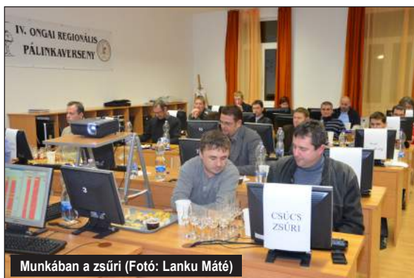
Munkában a zsűri