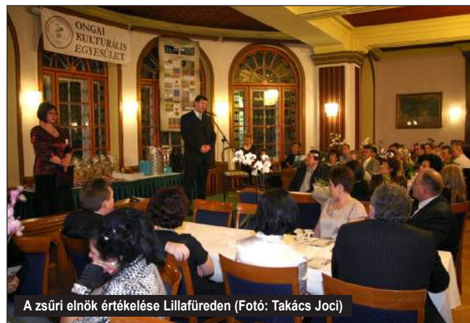
A zsűri elnök értékelése Lillafüreden