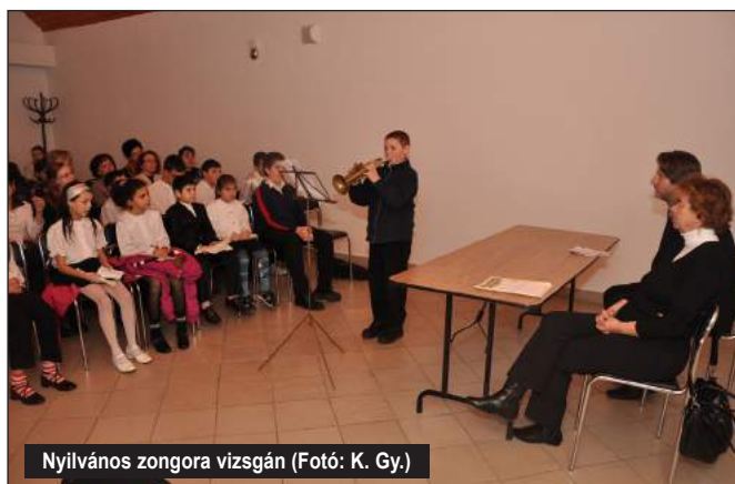
Nyilvános zongora vizsgán