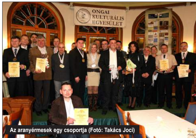
Az aranyérmesek egy csoportja