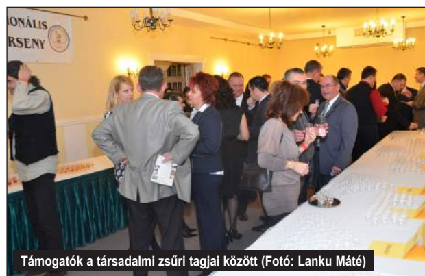
Támogatók a társadalmi zsűri tagjai között

Kft. - Tiszadob Miskolc Pláza - Miskolc MohaNet Mobilsystems Zrt. - Budapest Next Unio Magyarország Kft. - Budapest Nyírjes-Vad Kft. - Szerencs Ongai Horgász Egyesület - Onga Online fotótanfolyam Optimál 20 Kft. - Edelény Pap Tibor (Kaja-Tanya) - Nyékládháza Pelle Párlatház Kft. - Bükkaranyos P-Kolor Kft. - Onga Prion Sándor - Onga Radi és Társa Kft. - Alsózsolca Reanult Gold-Cars Kft. - Miskolc Rézangyal Pálinkapince - Eger SZER-2002 Bt. - Szerencs Szerencs-Mezőkövesd Térségi Gyümölcs- és Szőlőtermelői, Értékesítő és Feldolgozó Szövetkezet - Bekecs Szomolyai lekvárház - Szomolya Szonóczky család méhészete - Sajópetri Tóth Tibor - Onga Tóth Tibor - Tarczal Tóth Zsolt - Szentistván Trixon B. Kft. - Damak Truck Land Kft. - Miskolc Urbán Therm Ker. és Szolg. Kft. - Méra Urszin László - Onga Vámosmikolai Pálinkafőzde - Vámosmikola Vino Domus Borház Kft. - Eger