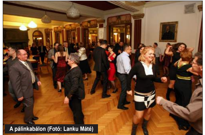
A pálinkabálon

nufaktúra, Boldogkőváralja - Bestillo, Borsodszirák, Bükkaranyos, Csökmő, Dabas, Damak, Dunaszekcső, Edelény,