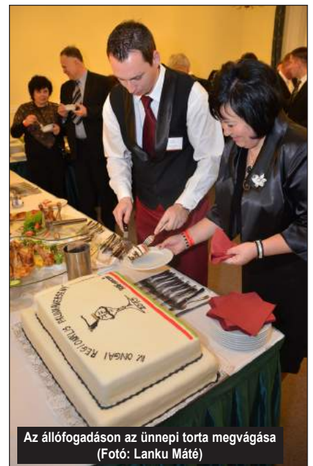
Az állófogadáson az ünnepi torta megvágása