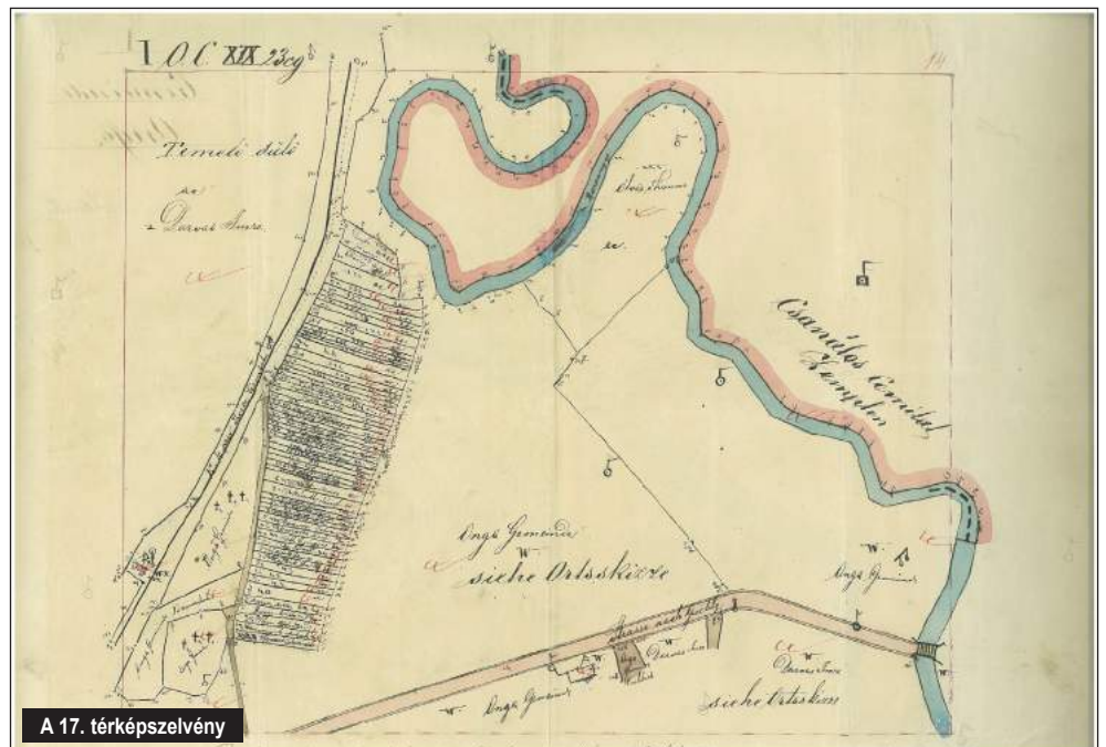
A 17. térképszelvény